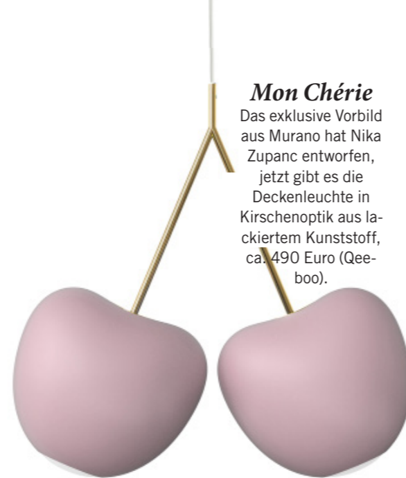
Mon Chérie Das exklusive Vorbild aus Murano hat Nika Zupanc entworfen, jetzt gibt es die Deckenleuchte in Kirschenoptik aus lackiertem Kunststoff, ca. 490 Euro (Qeeboo).

Sanfte Pudertöne, viel Glanz und natürliches Geflecht – so fühlen wir uns wie an der Riviera